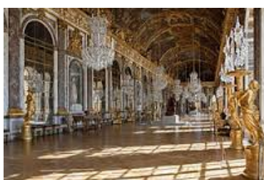
Galería de los Espejos